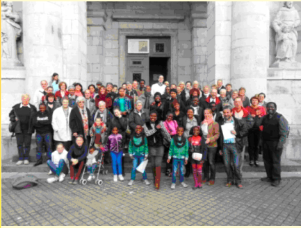
Messe et Balade intergénérationnelle à Verviers

3) Retisser les liens en motivant diverses équipes , les familles et les communautés de notre unité pastorale , dans la ligne du projet diocésain (exemple : « chantier paroisse ») et du thème pastoral d'année proposé par l'Eglise de Belgique (exemple : « Etre chrétien aujourd'hui »).