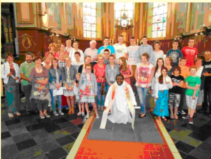
Messe Intergénérationnelle à Dohlain C'est prometteur !

4) Encourager les jeunes, les familles ainsi que d'autres fidèles à se rencontrer afin de prier, réfléchir, favoriser le « vivre ensemble », partager et échanger sur des stratégies de redynamisation de nos communautés .